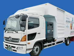
出張裁断車両も活躍中

機密抹消から廃棄などの静脈物流、処分前の機密書類お預かり、 PC廃棄、設定、保管、移転、レイアウト変更など、専門スタッフ による各種提案でお客様のお悩みを解決致します。