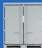
機密文書専用 保管コンテナ

丸新輸送(株) 阿賀野市京ヶ瀬工業団地 1062-3 info@marushin-exp.com